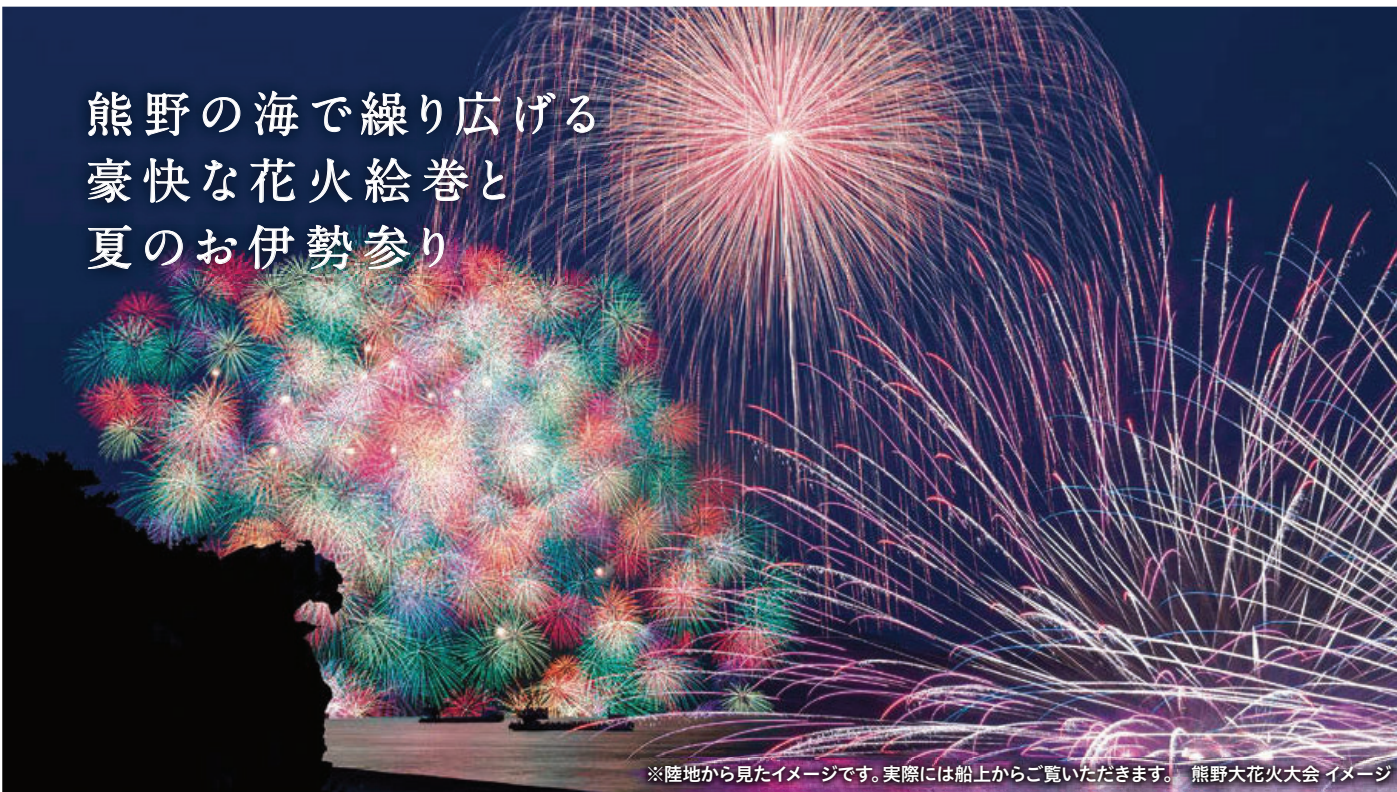
※陸地から見たイメージです。実際には船上からご覧いただけます。熊野大花火大会 イメージ