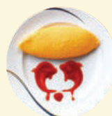
職業体験一例 ケチャップアート

旅行代金 (2名1室利用時 お一人様) ( ) は子ども代金 2歳以上12歳以下 (小学生まで)