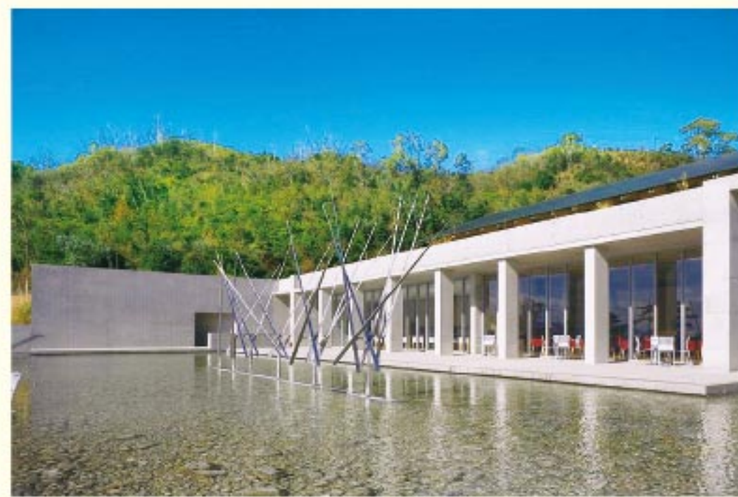
ベネッセハウス パーク外観

安藤忠雄が設計した数少ない木造建築。長いスロープや階段、通路による移動、切り取られた開口部からの外光など、施設内外の現代アートを滞在中に全身で感じられます。