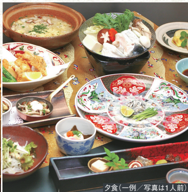
夕食(一例/写真は1人前)

※鎮火祭は新型コロナウイルス感染症の影響で、急遽中止または縮小規模での開催となる場合があります ※厳島神社社殿・大鳥居の工事が行われています(2022年12月終了予定/※日付未定・工事の終了時期が長引く可能性もあります)。工事が完了していない場合は、足場が組まれており、一部ご覧いただけないことがあります。予めご了承ください